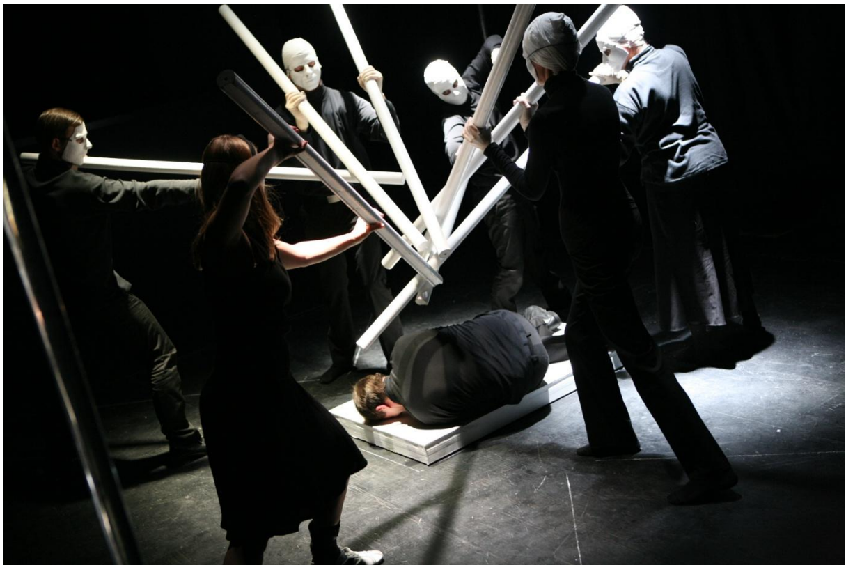
Ensemble – IV. Akt